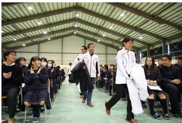
オリンピック入場