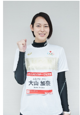
大山加奈 (バレーボール)