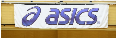
アシックスジャパン