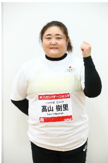
高山樹里 (ソフトボール)