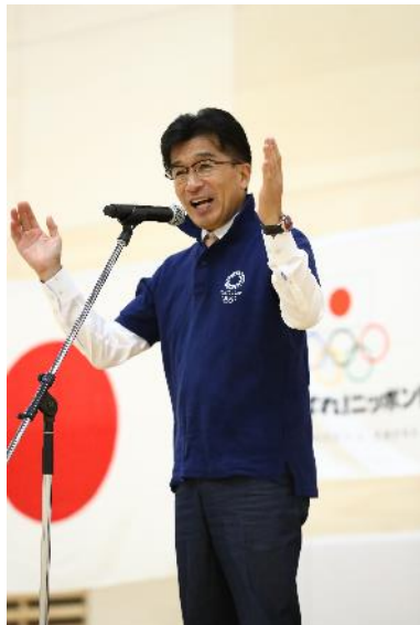
福島市市長 木幡浩