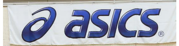
アシックスジャパン