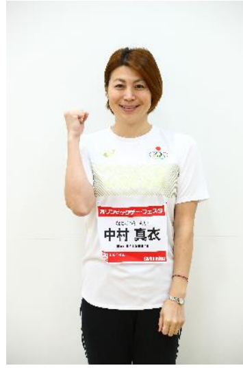
中村真衣 (水泳/競泳)