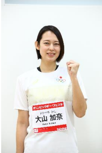
大山加奈 (バレーボール)