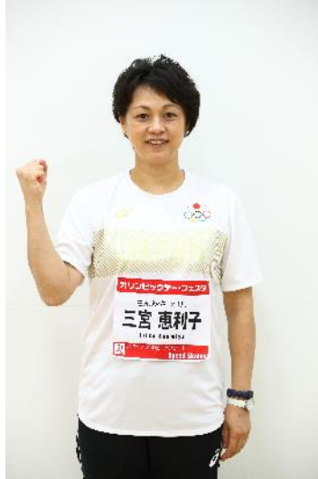
三宮恵利子 (スケート/スピードスケート)