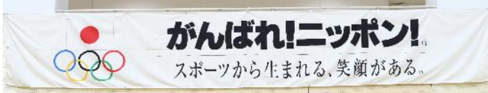
JOCメッセージバナー