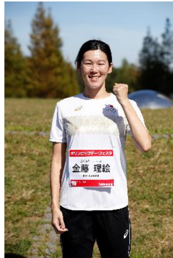
金藤理絵 (水泳/競泳)