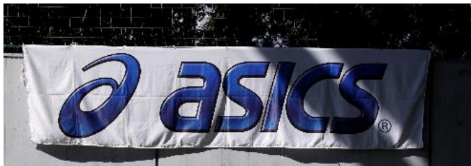
アシックスジャパン