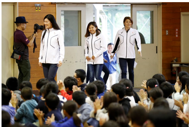
オリンピック入場