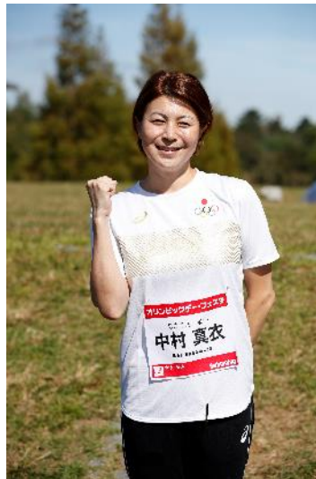
中村真衣 (水泳/競泳)