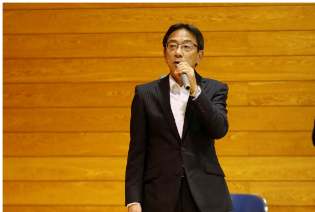
田村市立常葉小学校校長