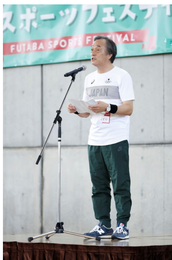
双葉町町長 伊澤史朗