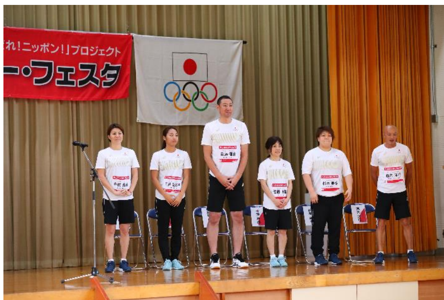
◇チームジャパン代表挨拶