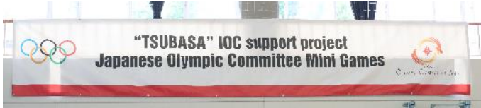
JOCメッセージバナー