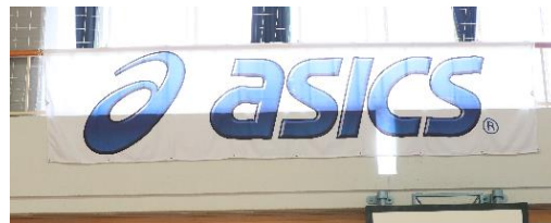
アシックスジャパン