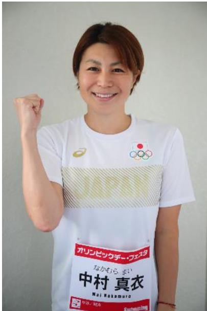
中村 真衣 (水泳/競泳)