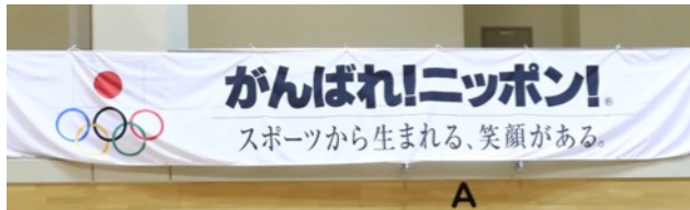
JOCメッセージバナー