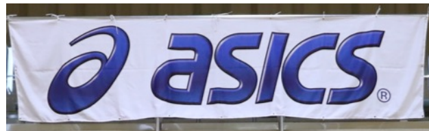
アシックスジャパン