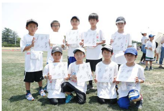
・当日受付先着順に配布されたオリンピアンサイン会参加券を手にオリンピアン全員からサインをもらう参加者。