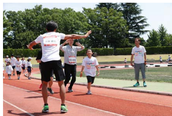
・ゴールではオリンピックがハイタッチや大きな声援と共に参加者を迎える。