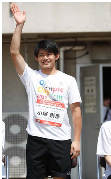
小塚 崇彦 氏 (スケート・フィギュアスケート)