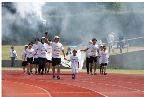
・エスコートキッズがオリンピック・ムーブメントアンバサダー、オリンピックと手をつないで入場。