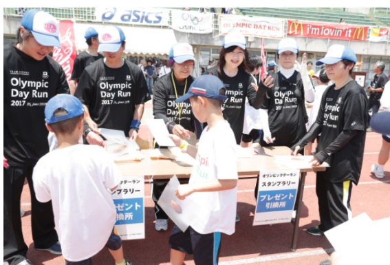
・5つのポイントをめぐるスタンプラリーを実施。