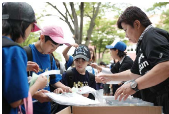
・当日は天候にも恵まれ、受付開始時間前に多くの参加者が来場。