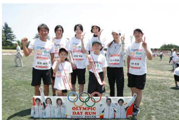
・オリンピックが質問箱から引き当てた質問者と共に。