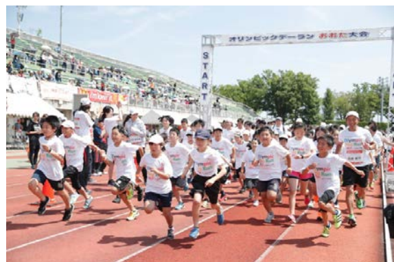
・オリンピックと一緒にジョギングスタート。