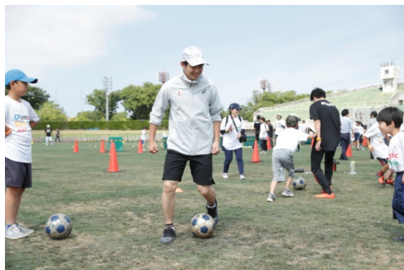
・オリンピックと一緒にスポーツ体験を楽しむ参加者。