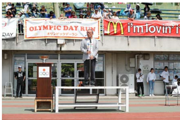
・主催者を代表して、清水聖義 太田市長から挨拶。