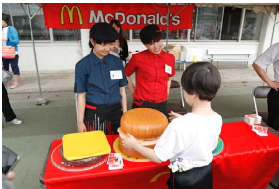
・食材を正しい順番に重ねてハンバーガーを完成させる。食材が体に果たす役割を知ってもらう食育プログラム。