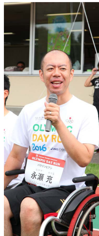
永瀬 充 氏 (アイススレッジホッケー)