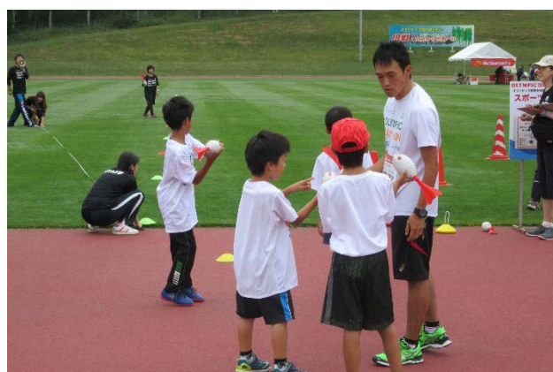
・オリンピックと一緒にスポーツ体験を楽しむ参加者。