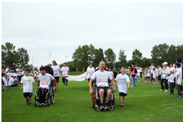
・エスコートキッズがオリンピック・ムーブメントアンバサダー、オリンピックと手をつなぎ入場。