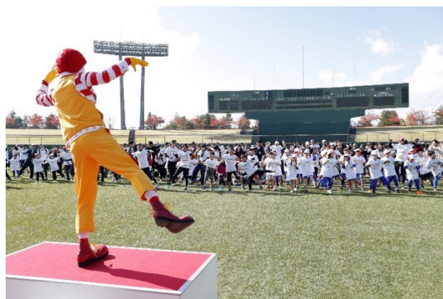
・参加者全員でドナルドと一緒にオリジナル体操を実施。