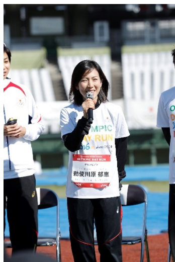
勅使川原 郁恵 (スケート・ショートトラック)